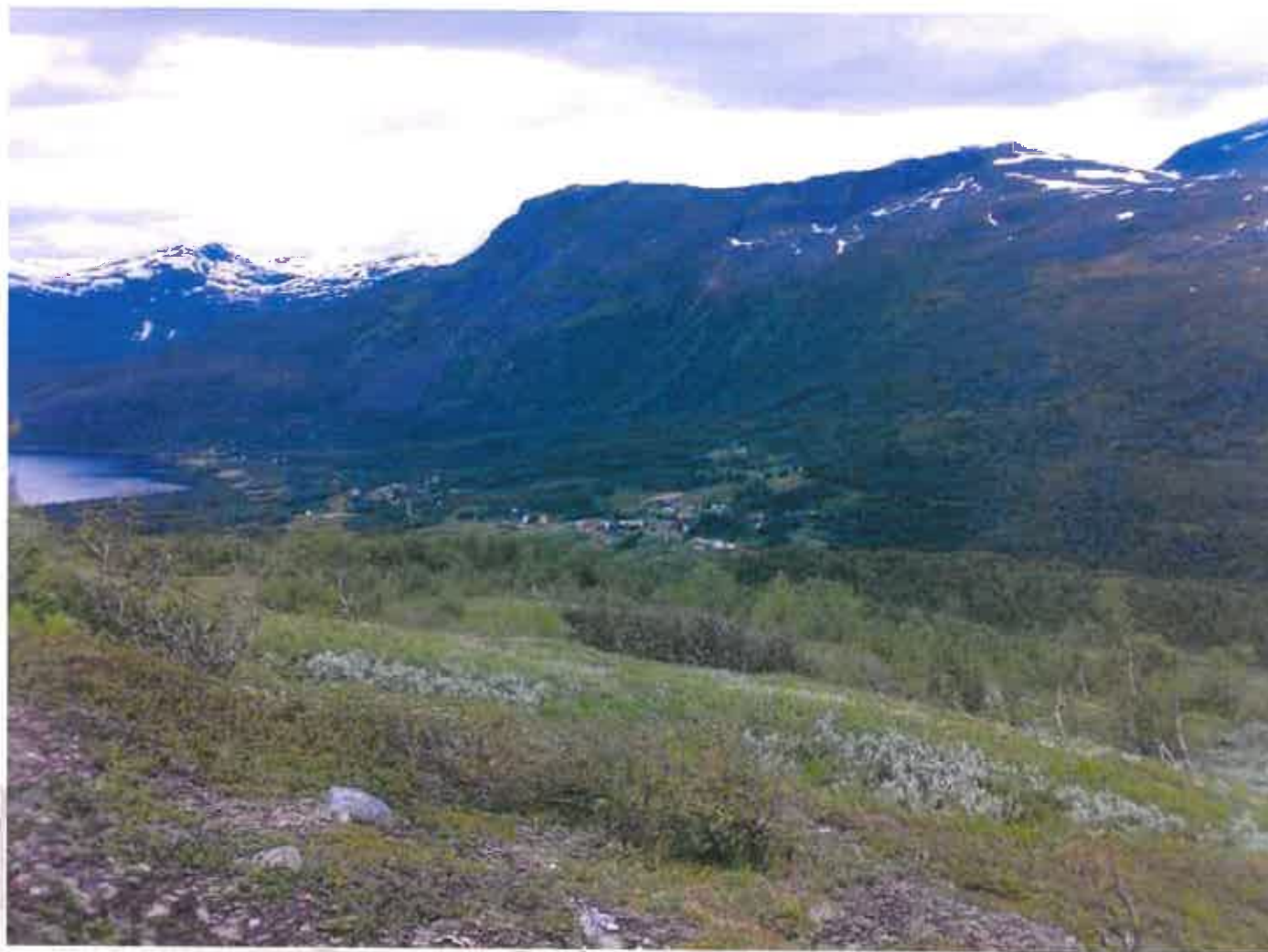
Utsnitt fra Áravuobmi/Vassdalen sett fra Lillebálak. Árajávrru til venstre.