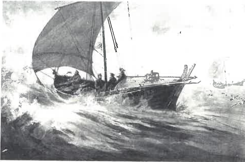
Det var vanlig at samer utrustet egne mannskap og båter til Lofotfiske. Her portrettert av Milton J. Burns: «Lappiske fiskere vender hjem fra Lofoten».

sorenskriveren og la riktig antall daler på bordet; det skulle betales pr. alen kjø. Peder var ikke så rapp i hodet, eller han hadde ingen penger, så han fikk en mindre dom på seg.