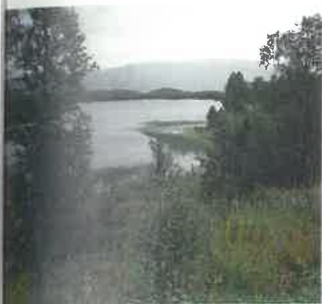
Det sies at boligen til Buks-Beret lå akkurat her mellom bjørkene, ved siden av riksveien i Vassli i Ballangmarka, utsikt mot Dypvann.

Gutten tilsto da at han hadde tatt «pene, blanke halvskoa hos presten og lagt dem i vedsjåen».